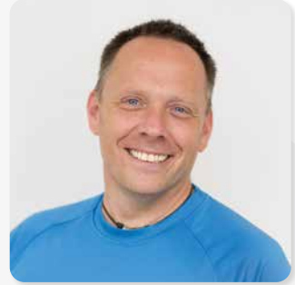
Christian Arens Haustechnik